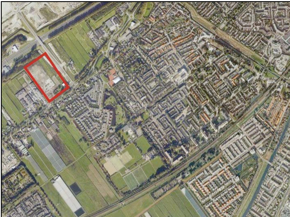
Afbeelding 1: Ligging van het plangebied

De vestiging van Hornbach op het perceel Hoofdweg-Noord 25a is gelegen ten noordwesten van de kern Nieuwerkerk aan den IJssel en ligt tussen de rijksweg A20 en de Hoofdweg-Noord. Het terrein wordt ontsloten via de Laan van Avant-Garde, die Nieuwerkerk aan den IJssel verbindt met Nesselande. Aan de andere zijde van deze ontsluitingsweg staat de realisatie van sportpark 'Kleine Vink' gepland. Het hele perceel van de Hornbach is omsloten door watergangen.