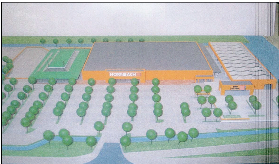
Afbeelding 3: Impressie met overkapt drive-in

Als extra service richting de klanten zal de reeds vergunde drive-in (zie § 3.2) voor een groot deel worden overkapt. Hierdoor is het mogelijk om bij slechte weersomstandigheden op een droge wijze grove bouw- en tuinmaterialen te laden en lossen respectievelijk verhuurde machines uit te geven of in te nemen. De overkapping heeft een bouwhoogte van 9,25 meter en meet ongeveer 4.500 m 2 . De overkapping zal niet leiden tot een toename van het aantal vierkante meters verkoopvloeroppervlak. Deze blijft gelijk aan het reeds vergunde oppervlak, zoals beschreven in §3.2. Afbeelding 3 laat een impressie zien met een overkapt drive-in.