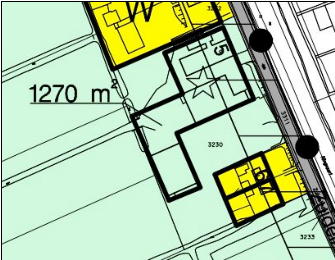
Afbeelding 2: Uitsnede plankaart thans geldende bestemmingsplan "Eendragtspolder"

In het bestemmingsplan "Eendragtspolder" is het plangebied bestemd voor 'Agrarische doeleinden met landschappelijke waarden' met de nadere aanduiding "AL" (zie afbeelding 2). Deze gronden zijn onder andere bestemd voor agrarische bedrijfsuitvoering in de vorm van agrarische grondgebonden bedrijven. Bouwwerken mogen alleen binnen het op de plankaart aangegeven bouwvlak worden opgericht en moeten ten dienste staan aan een volwaardig agrarisch bedrijf. Daarbij mag het maximale oppervlak aan bebouwing binnen het bouwvlak, zoals op de plankaart aangegeven, niet overschreden worden.