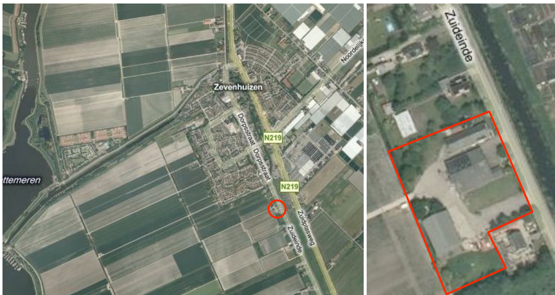
Afbeelding 1: Het plangebied in relatie tot zijn omgeving.

Het plangebied is gelegen in de Eendragtspolder, ten zuiden van de kern Zevenhuizen. Het perceel wordt ontsloten door de weg 'Zuideinde' en de grens van het onderhavige wijzigingsplan wordt gevormd door de kadastrale grenzen van het perceel.