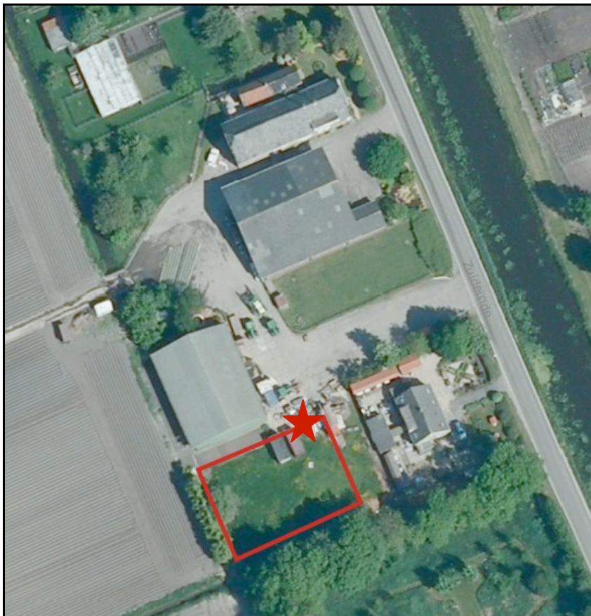
Afbeelding 3: Plaats nieuwe loods op perceel

Voor een doelmatige voortzetting van de huidige bedrijfsvoering en een eventueel toekomstige uitbreiding hiervan is het noodzakelijk om een werktuigenberging op te richten. Dit wordt ook door de Agrarische Beoordelingscommissie onderstreept (zie bijlage 1). Deze schuur kent een oppervlakte van ongeveer 400 m 2 . Onderstaande afbeelding geeft ruwweg de locatie van de nieuwe loods op het perceel weer. Voor deze locatie is gekozen, vanwege de diverse hoogteverschillen die aanwezig zijn op het erf. Daarnaast wordt het 'plein' tijdens het inschuren en afvoeren van aardappelen in gebruik genomen door trekkers met kiepers en de inschuurlijn met transportbanden. Deze ruimte kan dan ook niet bebouwd worden. Daarbij zorgt deze positionering ervoor dat de bestaande verkeersbewegingen op het perceel niet drastisch veranderen. De ingang van de nieuwe berging komt namelijk ter plaatse van de ster (zie afbeelding 3).